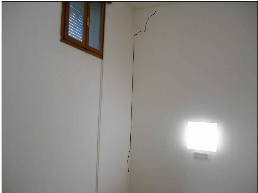
Mancanza di ammortamento "a"